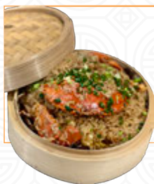
蟹 糯 米 飯