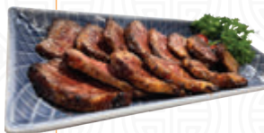
甜mi mi 牛叉燒