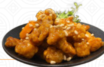
蜜桃 松子 咕嚕 肉