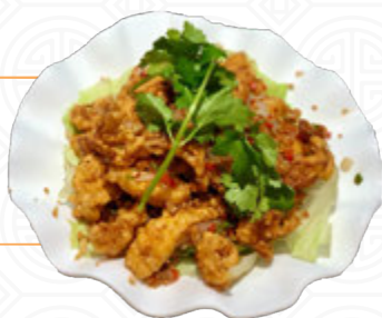
椒 鹽 茄 子