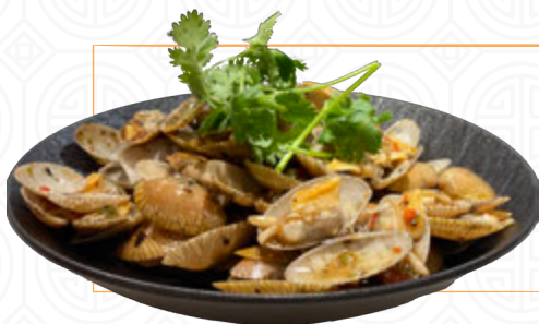
豉 椒 炒 花 甲